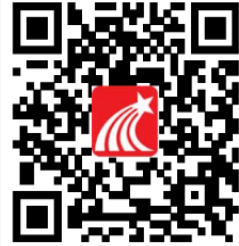
超星移动图书馆客户端&悦读电子书阅读器