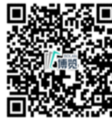
博尔图图书存贮系统