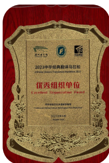
■广外图书馆喜获“优秀组织单位”

于近日在上海图书馆东馆圆满落幕。此次活动受到广东国际频道、羊城晚报等多家媒体追踪报道，扩大了中华文化在海外的影响力。