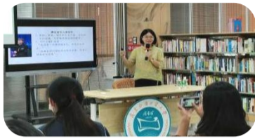
■悦读沙龙讲座现场

同时，为了进一步提升师生读者的信息素养和科研能力，为后续的学习和科研打下坚实的基础，图书馆联合数据库商推出了信息素养系列讲座，邀请了校内外各领域的学术专家和数据库软件专家为同学们讲解各类数据库和学术软件的实际操作使用，以及学术研究步骤、论文撰写等各个层面的实践方法。通过这些讲座，我们引导师生读者熟悉各种工具的使用，并将其应用到科研实践中去。