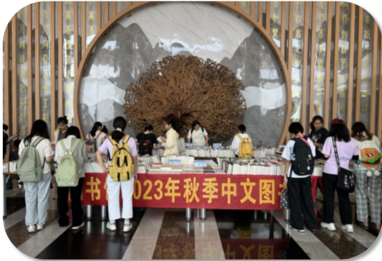
■大学城校区中文书展

此次书展为三年来首次线下实体选书活动，现场反响热烈，众多师生前来浏览并积极推荐图书，既有学术大咖、科研骨干、青年教师，也有