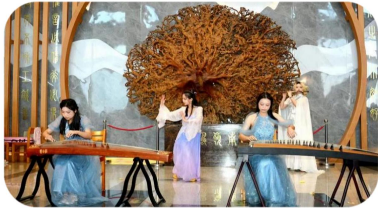
■“诗歌趁年华”快闪活动

秋风吹拂，书香四溢。广外图书馆以书为媒，策划并开展了第十三届图书馆文化节活动，形式多样的阅读推广活动接踵而至，不仅有力地推动了全民阅读的普及，同时也丰富了师生读者的校园文化生活。本次文化节始于金秋十月，不仅有悦读系列讲座呈现绚烂的世界文化和圣人哲思，带领读者寻找人生哲理；还有墨韵飘香中传承中华优秀传统文化的书法研习会；更有赏心悦目的快闪活动“诗歌趁年华”和多语夜读会，让读者切身感受到诗歌的魅力。同时，紫云读书社在此期间也积极筹划举办一系列学思并举、轻松有趣的活动，如紫云观影会、经典图书品鉴会等，带来精彩影片与好书分享；英语角和日语角拓展了读者语言学习的新方式；爱心赠书、公益派书等活动既丰富了文化节的内涵，也传递了爱心和知识。本次文化节系列活动获得师生一致好评。图书馆一如既往地以广大读者的需求为导向，不断创新，为大家带来更多元化、更丰富的文化活动。