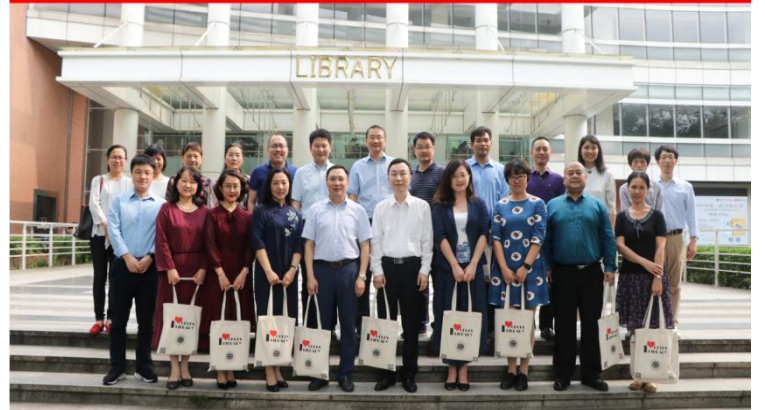
阅读推广委员会委员合影