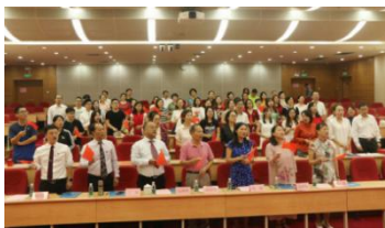
全体唱响《我和我的祖国》