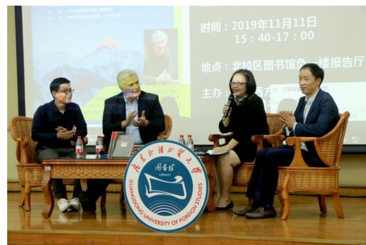
悦读讲堂“与格鲁吉亚总理顾问共读《总统的猫》”活动现场

自活动开展以来,文化节受到广大师生广泛支持和一致好评,极大地提升了师生的读书热情,进一步树立了图书馆的文化形象,提高了对读者的服务水平。