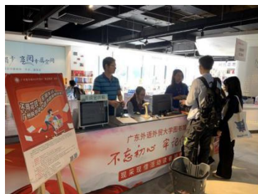
现采现借业务办理中

在广州购书中心1-5楼选择自己感兴趣、符合学校购书原则的图书。所选图书在中心6楼经工作人员现场查重后,便可凭一卡通当场办理借阅手续,个人购买的图书也可享受八折优惠。经过5个小时的选购,本次读者们共采书600余册。读者们对图书馆贴心便捷的服务非常赞赏。