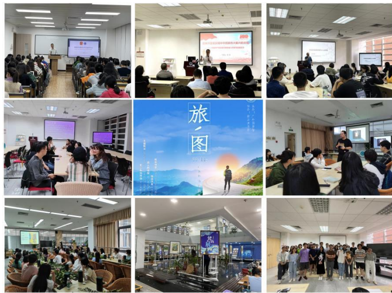
■ 第十一届图书馆文化节精彩瞬间

此外,南校图书馆为回馈广大读者朋友,举办了一场“书海拾遗”派书活动,将学长学姐或捐赠或遗留的书籍尽数送出,不少读者在活动中与书中的知识和原主人的回忆来了一场不期而遇。