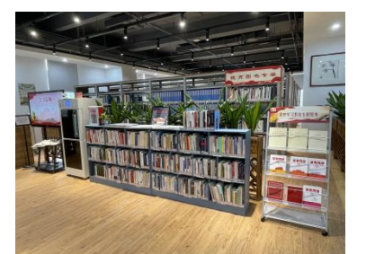
■ 知识城校区图书馆书库

图书馆始终践行“博爱 公允 至诚 服务”的馆训,重视来自读者的反馈,持续优化读者的阅读体验,注重结合实际来不断改进馆容馆貌,成果斐然,获得广大读者的一致好评。未来我馆将持续优化软硬件服务设施,不断营造更好的学习环境,全力满足读者需求。