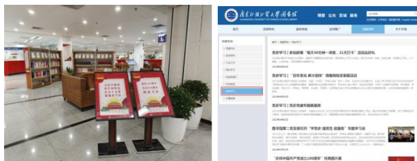
■党史学习教育阅读专区 ■馆网设置“党史学习”专栏

作为学校的文献信息资源中心，图书馆积极开展党史党建及“四史”专题的多类型、多载体文献资源订购工作，为党史学习教育提供可靠资源保障，并全方位立体化推介党史党建文献信息，助力党史学习教育。