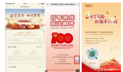
■开展阅读推广系列活动

“每天30分钟一讲座，21天打卡”活动，汇集名师，将军院士开讲，和读者共同回顾百年峥嵘岁月；“百年荣光 薪火相传”有奖知识竞答等活动，让读者重温党的百年历程大事件，深刻领悟党的光辉历程；“奋斗百年路，启航新征程”主题英语口语大赛，传承红色基因，激励读者用英语讲好中国故事，献礼百年华诞；图书馆还深挖馆藏资源，通过“库客数字音乐”数据库整理出多张红色经典专辑，与读者共同感受音符上的“红色经典”，营造党史学习良好氛围；通过“党史学习教育”专题视频讲座资源，引导读者树立正确地学习党史观，激发青春奋进之力。丰富多彩的党史学习活动极大地激发了广大师生们的学习热情，受到了广大师生的一致好评。