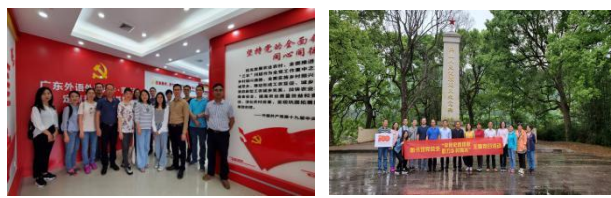
■赴清远阳山开展主题党日活动

人民武装起义纪念馆（纪念碑）及雷公岩村知青文化馆等党史教育基地开展“学党史践初心，助力乡村振兴”主题党日活动。