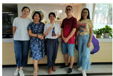
■广外紫云读书社指导老师团队

近日, 上海市图书馆学会第七届图书馆微服务研讨会暨第三届“图书馆新媒体创新服务案例评选活动”顺利举行。我校图书馆提交的“一小群人的阅读之旅——广外紫云读书社的分众阅读推广策略”案例荣获最佳图书馆新媒体创新服务案例(高校图书馆组)二等奖并在会议上进行展示汇报。