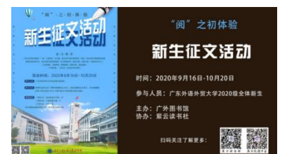
■新生征文活动宣传海报