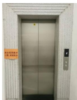
■ 图书馆新电梯投入使用

图书馆将继续践行“博爱 公允 至诚 服务”的馆训，持续优化软硬件服务设施，不断营造更好的学习环境，全力满足读者需求。