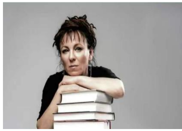
■奥尔加·托卡尔丘克

近日，图书馆悦读沙龙邀请西方语言文化学院副院长、波兰语系主任茅银辉教授，带领读者走近诺贝尔文学奖获得者波兰作家奥尔加·托卡尔丘克及其作品。茅银辉长期致力于波兰语言文学研究和中东欧人文交流，是多部波兰作品的主要译者，其中包括托卡尔丘克的小说《世界上最丑的女人》。