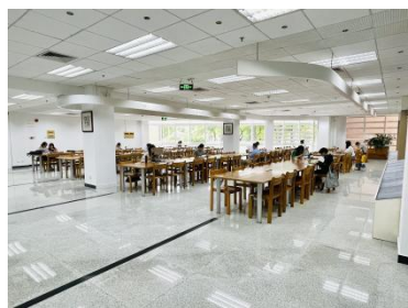
■ 改造后的新阅览区

图书馆持续扎实开展“我为群众办实事”活动，为了给读者提供更温馨、舒适的学习环境，充分利用图书馆空间资源，在北校区图书馆一楼校史馆迁址一教后，图书馆积极筹措资金，对原校史馆进行空间改造，并第一时间向读者开放。