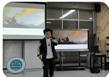
■经贸学院S.T.D歌队演唱

活动开始，一阵悠扬的古乐传来，来自经贸学院S.T.D歌队用动听的声线与优美的嗓音为我们演唱了几首经典的诗词乐曲，“我寄愁心与明月”“黄河之水天上来”“知否知否应是绿肥红瘦”，古诗作词，悠乐填曲，带领我们神游古朝，在悠扬的歌声中，在场同学也随之引吭。