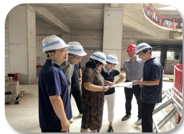
■建设小组了解项目总体进度