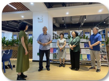
■馆领导班子现场调研

图书馆将继续与黄埔研究院、施工设计单位等各方加强沟通联系，进一步优化资源配置，以更好地满足知识城校区师生读者的需求。我们致力于把知识城校区图书馆打造一个集丰富馆藏资源、先进信息化设施和温馨学习氛围于一体的未来学习中心，为学校成为高层次人才培养基地和现代化校园典范提供强大的支持。