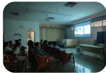
■《当幸福来敲门》观影现场

未来，图书馆将继续在校园文化建设中发挥重要作用，通过提供更多寓教于乐的精彩活动，为同学们创造一个充满活力、富有创意的学习空间。