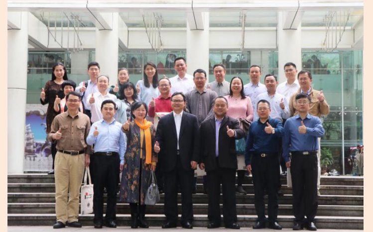
图二:广外阅读推广委员会成立