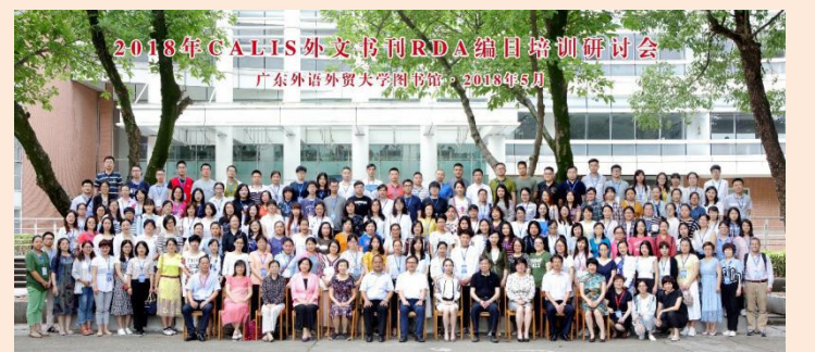
图三:图书馆承办CALIS外文书刊RDA编目业务培训研讨会